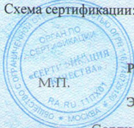
Схема сертификации: №3.